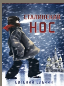
Евг. Ельчин «Сталинский нос» 10-11 лет