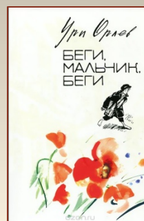
Ури Орлев «Беги, мальчик, беги» 13-14 лет