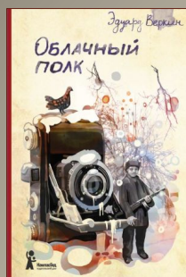
Эдуард Веркин «Облачный полк» 13-15 лет