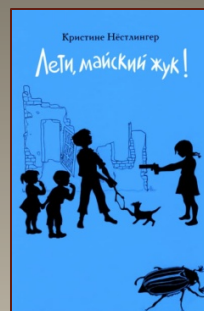
Кристине Нестлингер «Лети, майский жук!» 12-13 лет